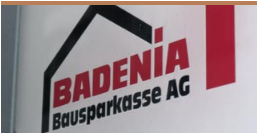
Badenia: Für viele längst kein Institut des Vertrauens mehr